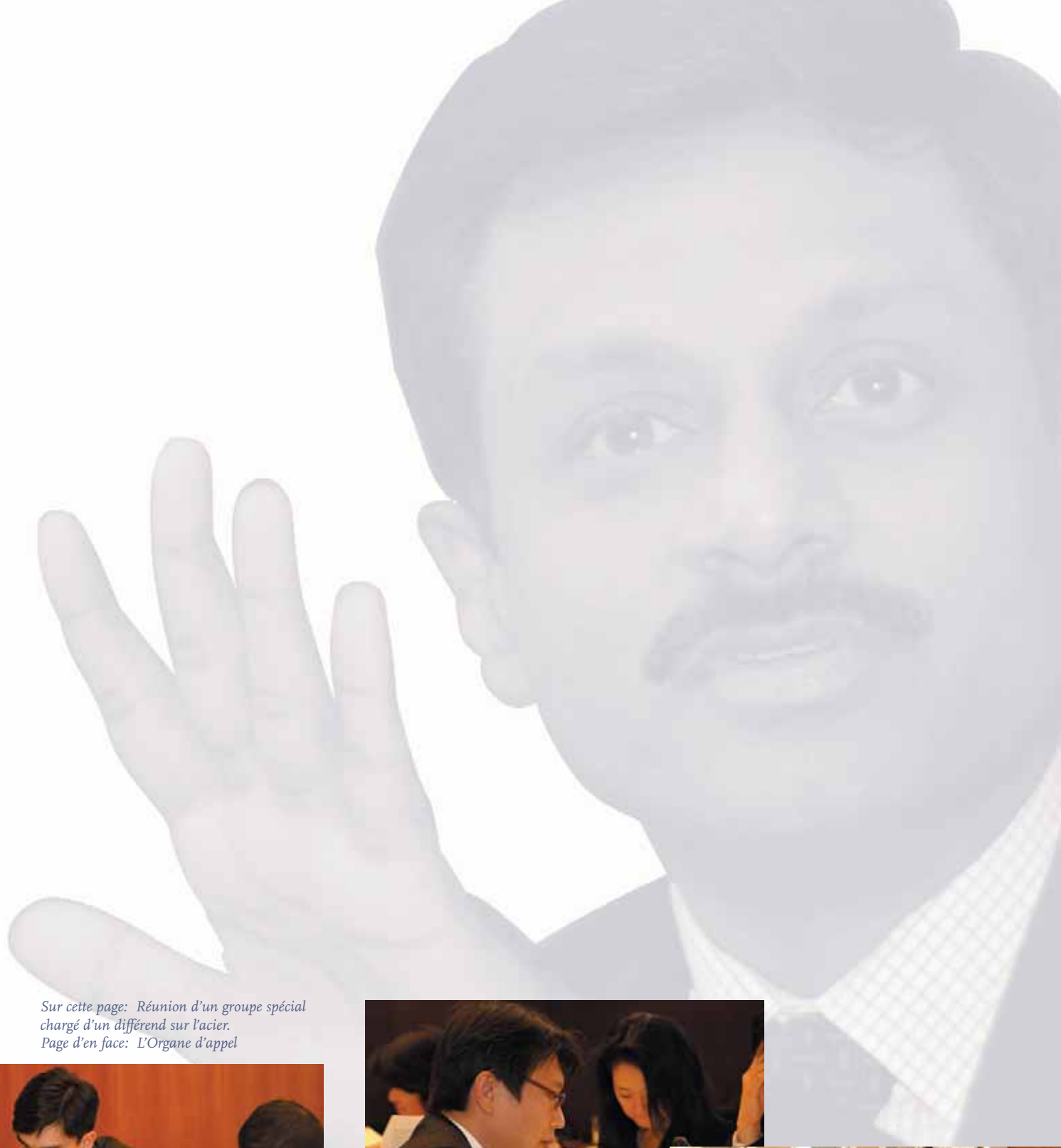
Sur cette page: Réunion d'un groupe spécial chargé d'un différend sur l'acier. Page d'en face: L'Organe d'appel